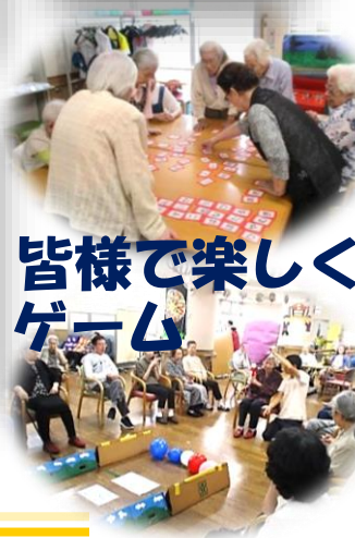
皆様で楽しくゲーム