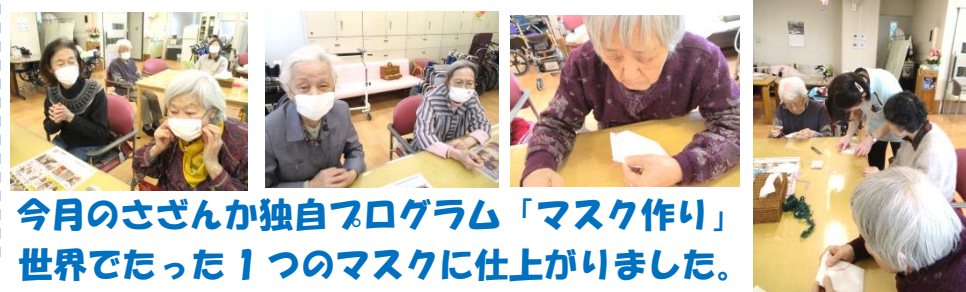
今月のさざんか独自プログラム「マスク作り」世界でたった1つのマスクに仕上がりました。