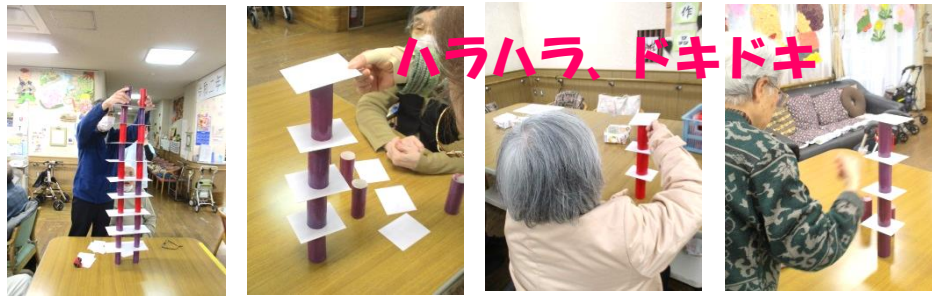
今月のゲームは「タワーを積み上げよう」です。スカイツリーを目指して、たかーく積み上げました。